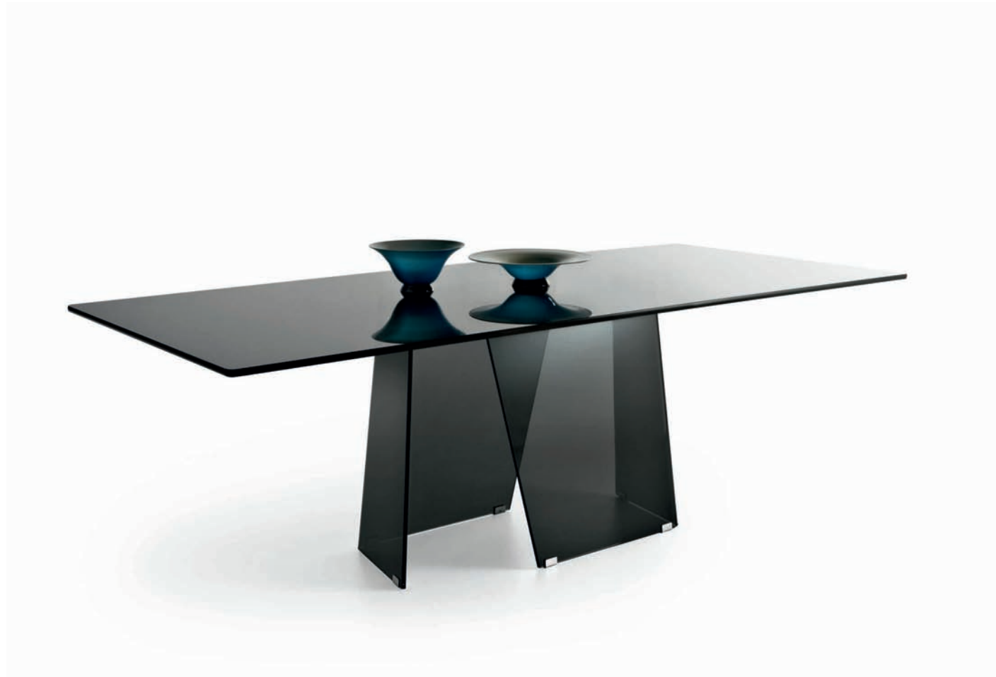
12 Naxos rettangolare / rectangular / rectangulaire / rechteckig